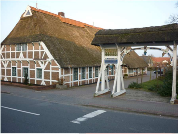
Das Dorfgemeinschaftshaus Neuenkirchen

Das schöne und gemütliche Dorfgemeinschaftshaus befindet sich in der Dorfstraße 56 in 21635 Neuenkirchen.